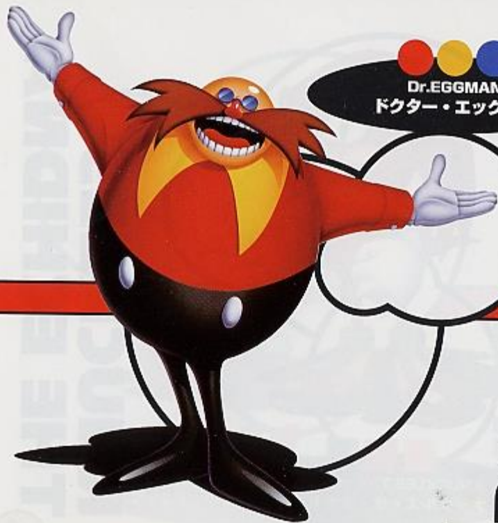
Dr. EGGMAN ドクター・エッグマン