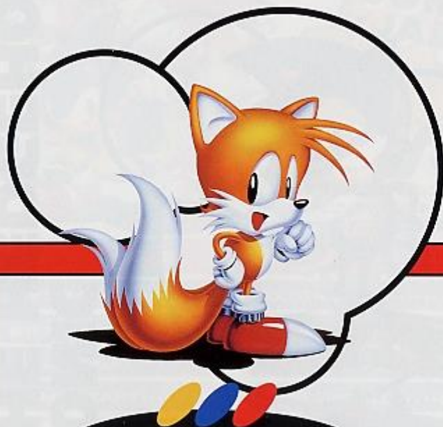
MILES "TAILS" PROWER マイルス "テイルズ" パウアー