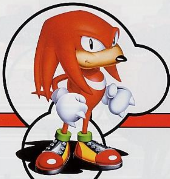
■ ■ ■ KNUCKLES THE ECHIDNA ナックルズ・ザ・エキドゥナ