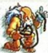
ビーストテイマー Beast-tamer