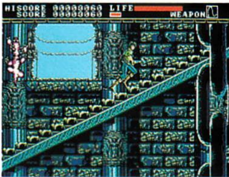
アーネスト・エバンス