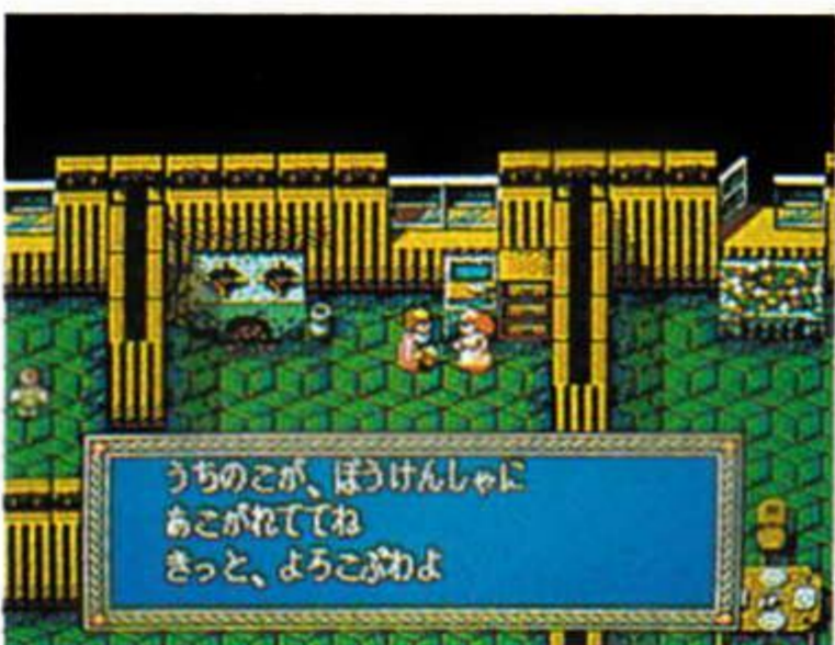
精霊神世紀フェイエリア