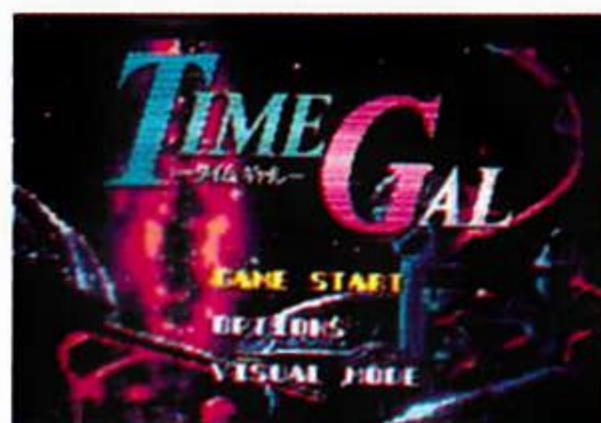
スタートメニュー画面