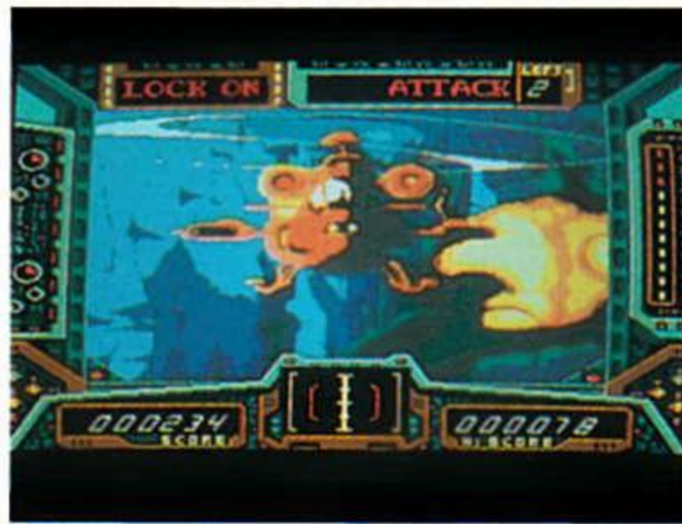
サンダーストームFX